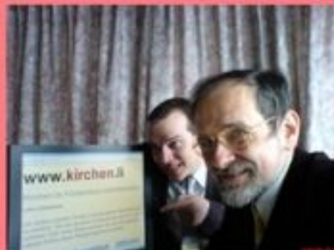
Interkonfessionelle Internetpräsenz 2006