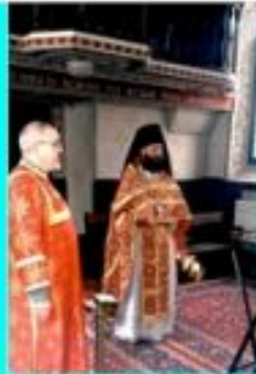
Gedenken für alle orthodoxen Verstorbenen, die im Schutze der liechtensteinischen Friedhöfe ruhen (Melde-TI 13.05.2020)