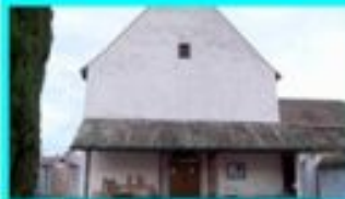
Serbische Gottesdienste finden weiter in Mels statt (unter Einhaltung der Schutzmassnahmen) Klosterweg 9, 8687 Mels