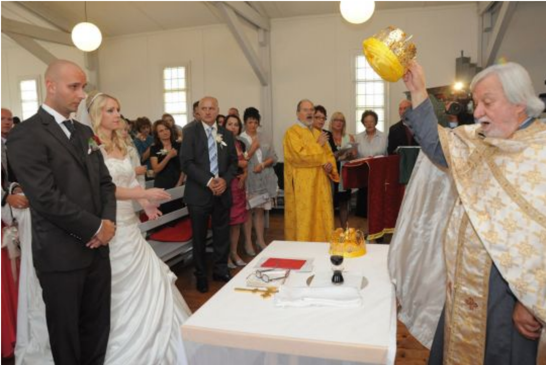
Bei einer Krönungszeremonie in Liechtenstein