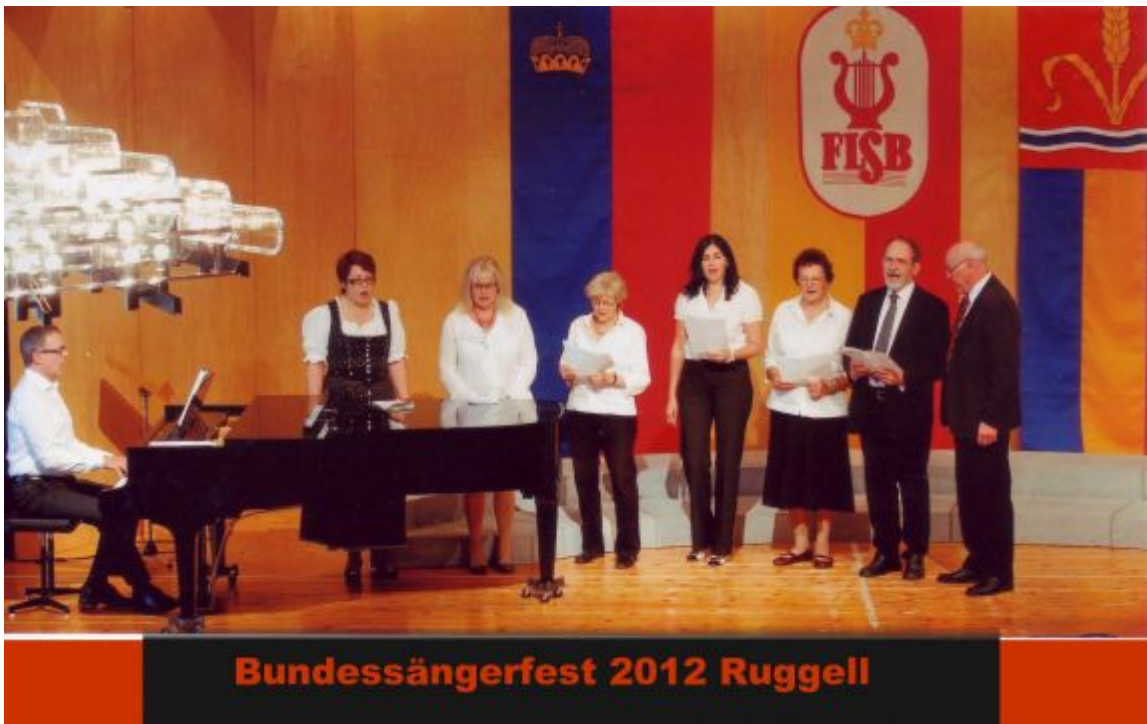
2012 in Ruggell unter der Landesfahne und dem Logo des Fürstlich Liechtensteinischen Sängerbunds