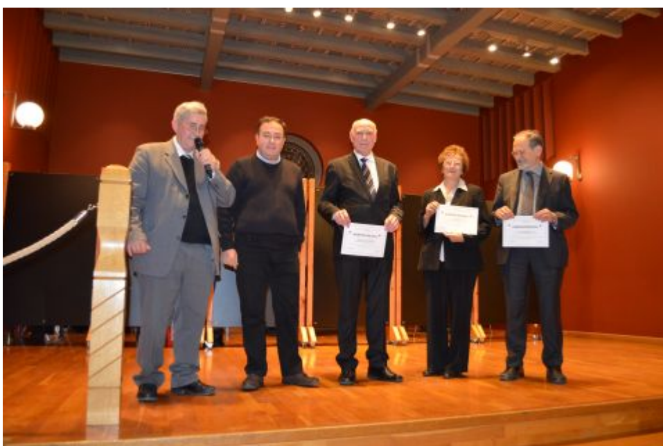
Ehrungen zum zwanzigsten Jubiläum 2013