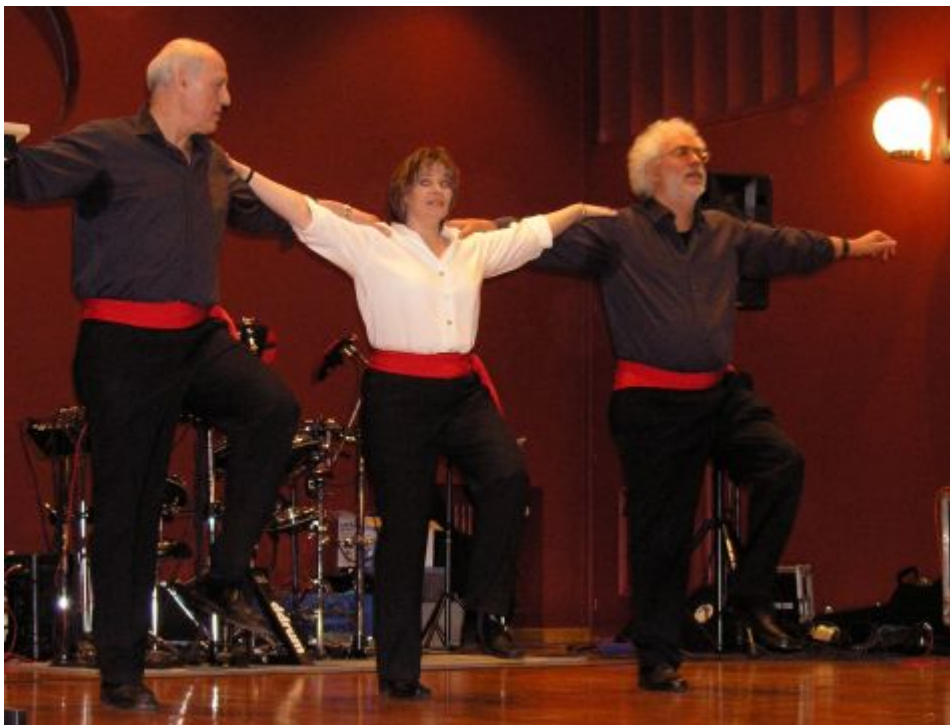
Griechische Tranzgruppe Chorepsete