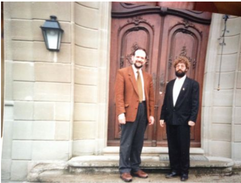
Verein für ostkirchliche Musik