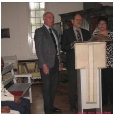
Die Kantorei als Trio