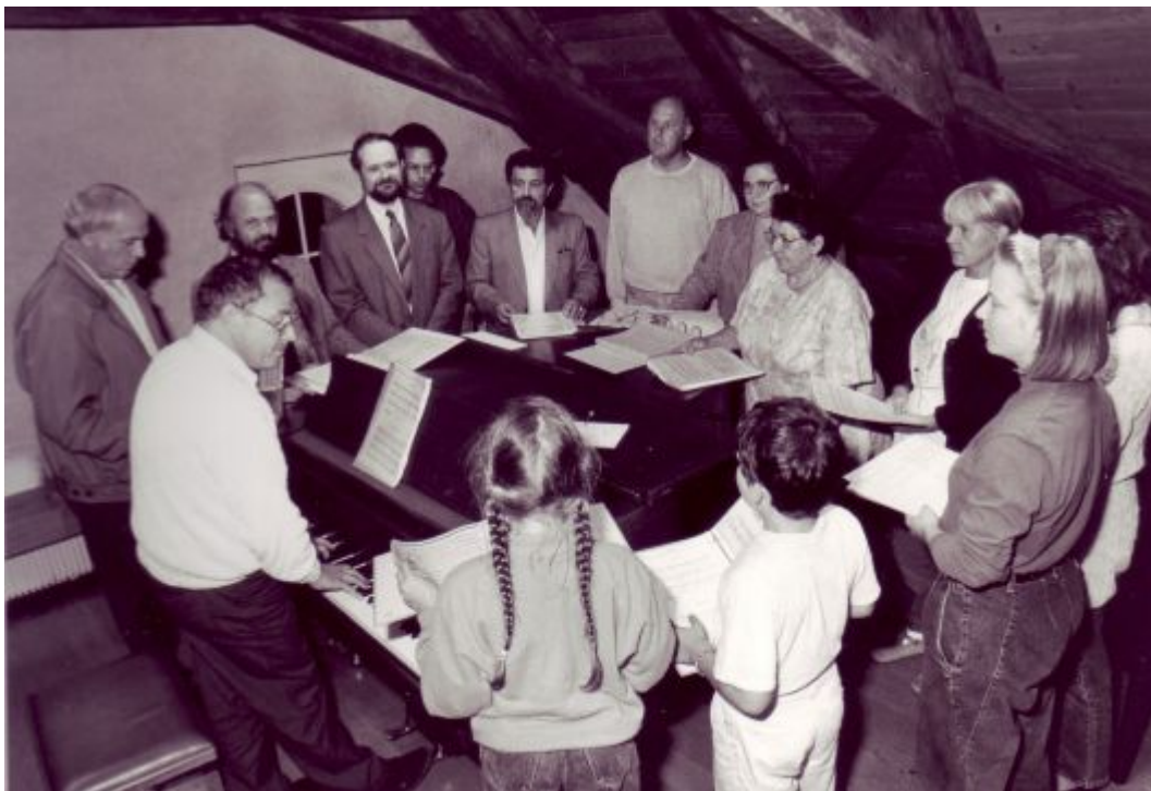
Aufnahme in den Sängerbund 1994