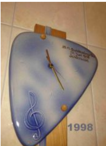
1998 in Schaanwald erhielt jede Delegation eine Keramikuhr