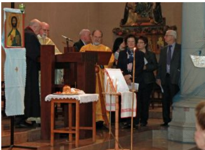
Vorbereitung zur orthodoxen Osternacht