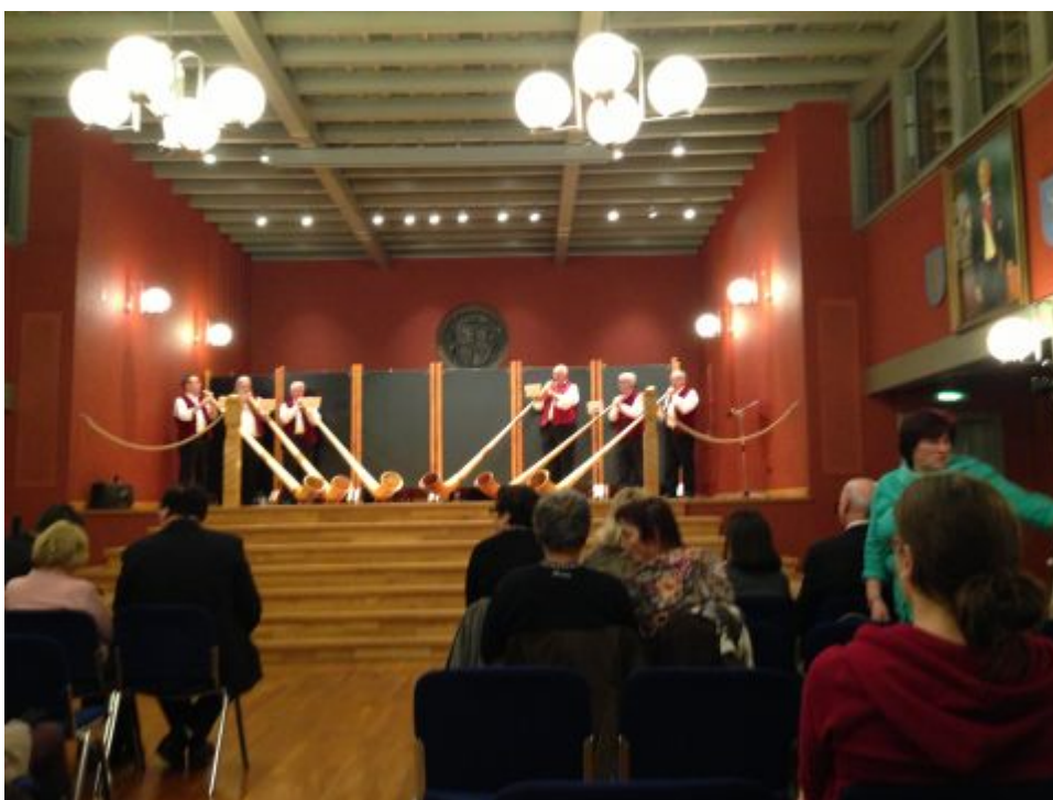
Alphornensemble aus Schaan