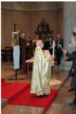
Gesang zur Lichtausstellung bei der Auferstehungsfeier in Schaan