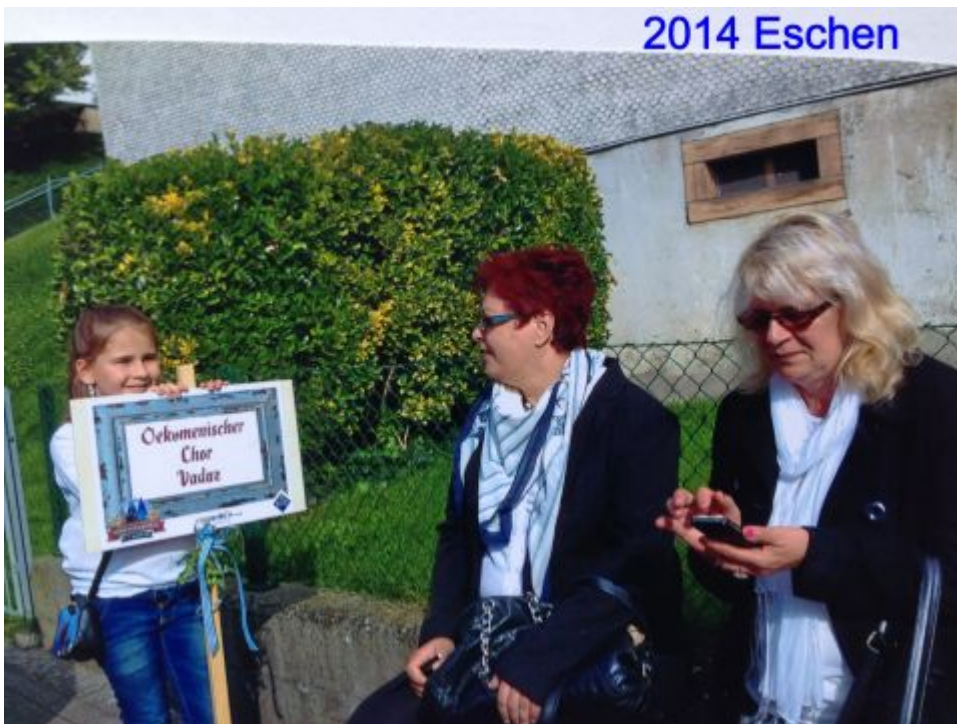
2014 die Überraschung auf die unsere Damen gewartet haben, war die Teilnahme am Umzug durch Eschen