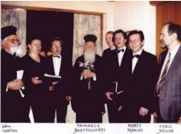
Kantorei und Gastchor beim Ökumenischen Patriarchen in Vaduz