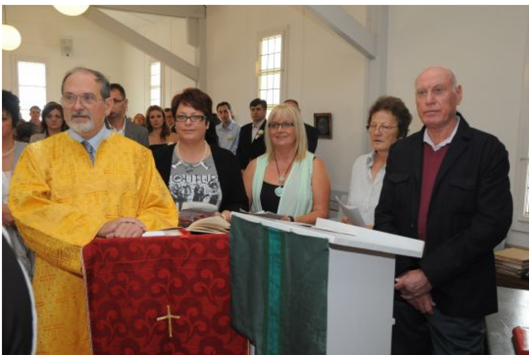
Kantorei vor dem Orthodoxen Gottesdienst in Vaduz