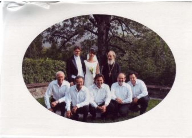
Bei einer orthodoxen Hochzeit im Appenzellerland