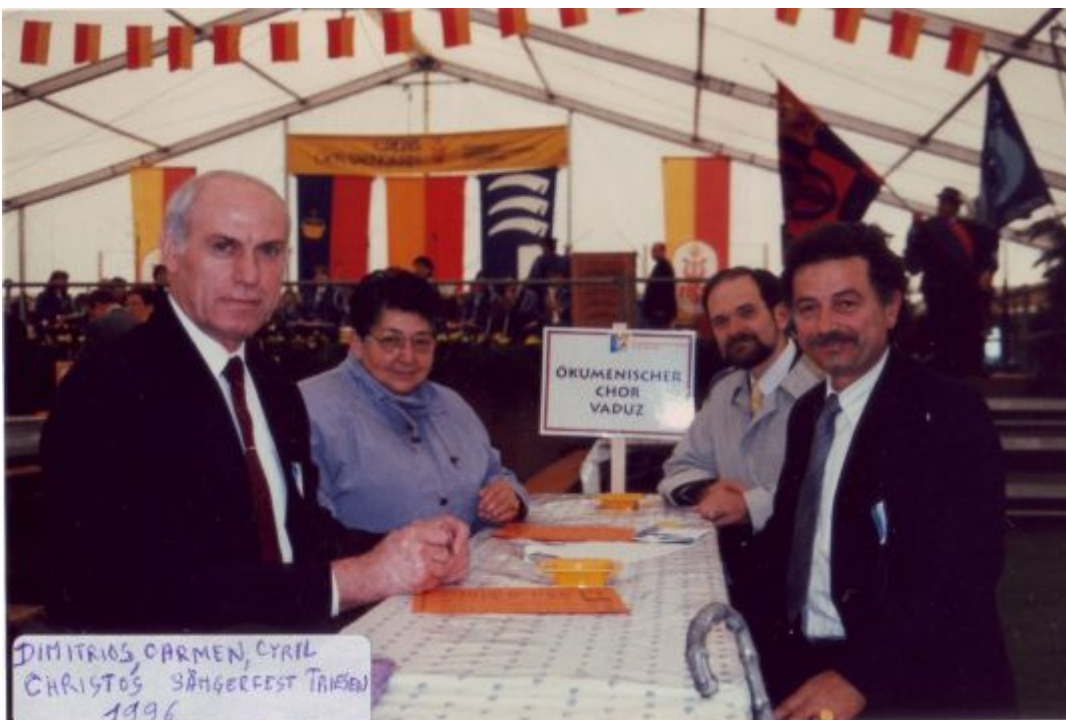
1996 die ersten vier Delegierten beim Bundessängerfest in Triesen

Klicken Sie auf das entsprechende Jahr !