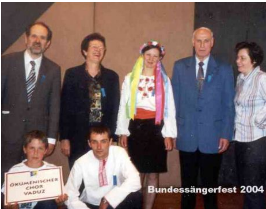
2004 ein zweites Mal zu Gast in Triesen