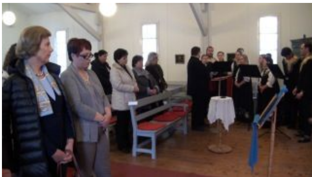
Kantorei und Gastchor beim fürstlichen Besuch der Johanneskirche