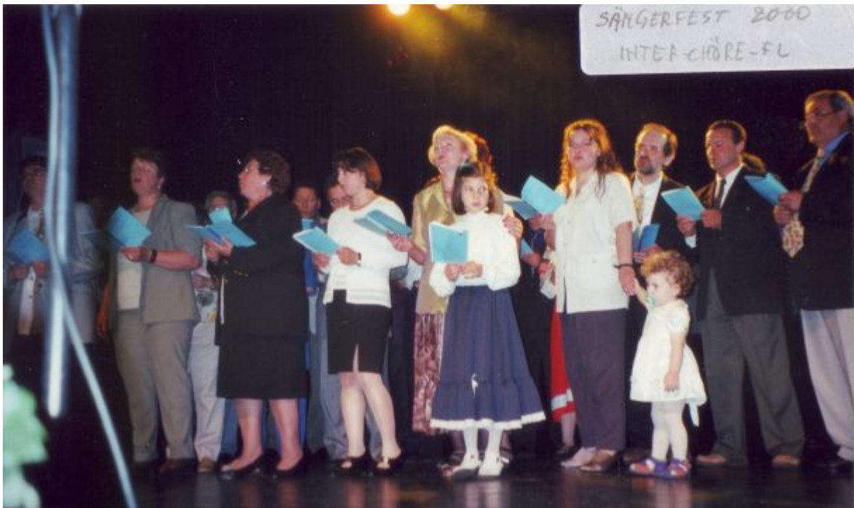
2000 mit Neapolitanischen und Slawischen Tänzen auf der Bühne im Vaduzer Saal