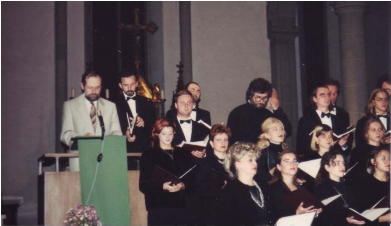
Erster serbischer Belgrader Gesangsverein