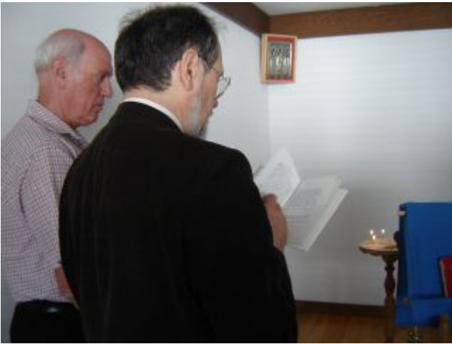
Kantoren bei einem orthodoxen Hausgottesdienst

Der Ökumenische Chor Vaduz beteiligt sich nicht nur am kulturellen sondern auch am kirchlichen Leben in Liechtenstein. Die orthodoxe Kantorei besteht aus Mitgliedern unseres Vereins, und gestaltet Gottesdienste nach bedarf in unterschiedlicher Zusammensetzung vom Einzelkantor bis zum Gemischten Kirchenchor.