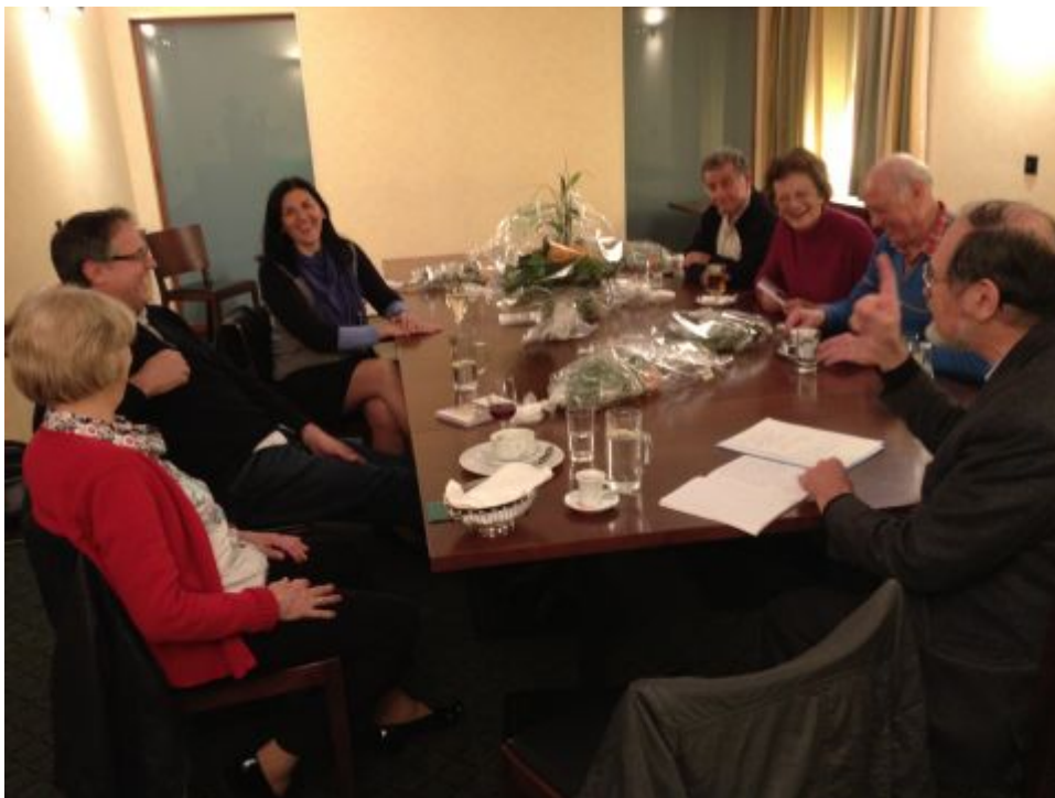
Arbeitsgruppe an der Generalversammlung 2012