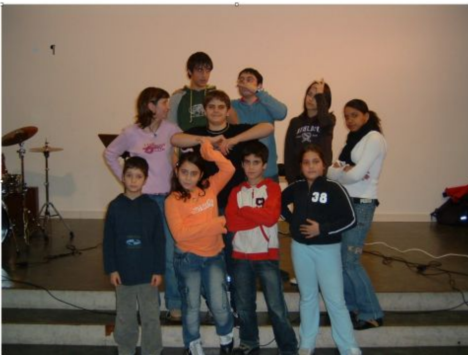
Italienisches Kinderensemble Ragazzi nel Mondo Balzers

Der ökumenische Chor pflegt schon seit der Gründung Kontakte zu verschiedenen Gesangs- Musik- und Tanzensembles. Einerseits mit hiesigen Vereinen , andererseits mit Russischen, Serbischen, Ukrainischen, Griechischen oder Italienischen Formationen . Hier die Liste deieser Partner-Organisationen mit Foto.